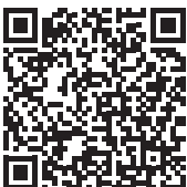
Josmar Lacerda Martins Prefeito Constitucional

Gabinete do Prefeito de Itatuba-PB, 25 de junho de 2026.